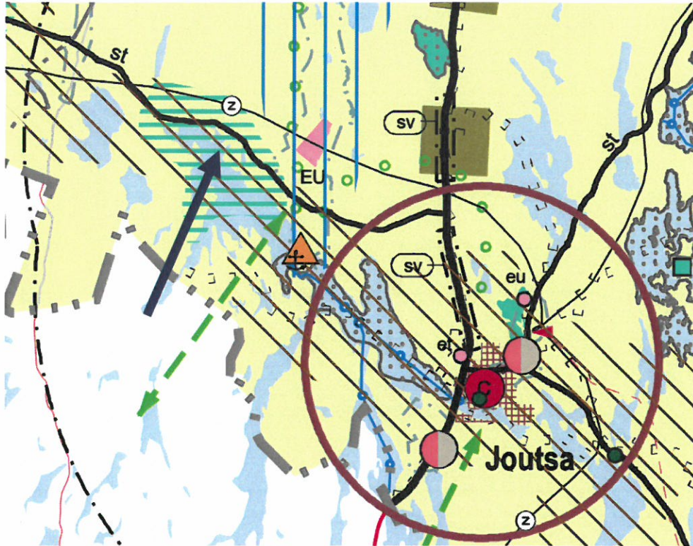
Kuva 2. Ote Keski-Suomen tarkistetusta maakuntakaavasta. Suunnittelualueen sijainti osoitettu likimääräisesti sinisellä nuolella.

Keski-Suomen liitto on aloittanut maakuntakaavan päivityksen. Päivitys koskee koko maakunnan aluetta, Kuhmoinen poislukien. Jatkossa maakuntakaavaa päivitetään Keski-Suomen alueella rullaavan maakuntakaavoituksen periaatteiden mukaisesti. Rullaavassa maakuntakaavoituksessa maakuntakaavaa muutetaan kertyneiden muutostarpeiden mukaisesti. Päivitettävän kaavan nimenä käytetään Keski-Suomen maakuntakaava 2040. Vireilletulovaiheen muutostarpeet liittyvät seudullisesti merkittävään tuulivoimatuotantoon, liikenteeseen ja hyvinvoinnin aluerakenteeseen. Maakuntakaavan päivityksen osallistumis- ja arviointisuunnitelma (OAS) on ollut nähtävillä 7.9.-30.10.2020 välisen ajan, ja osalliset ovat voineet lausua mielipiteensä 30.10.2020 mennessä. Lisää tietoa aiheesta ja kaavasunnittelun etenemisestä Keski-Suomen liiton internetsivuilla.