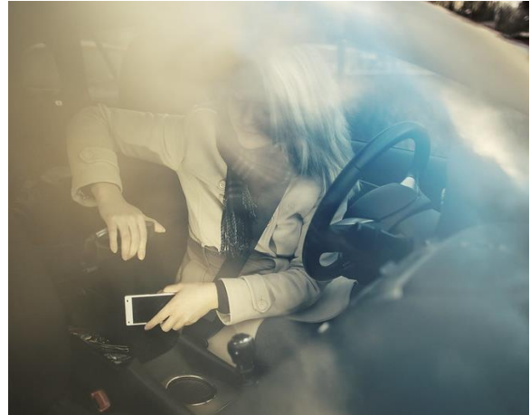
Kuva 2. Laitetaan kännykkä pois ajamisen ajaksi