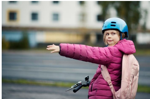
Kuva 4. Hyödynnä liikennekasvatuksen etäopetustehtäviä.

Liikennekasvatuksen järjestäminen onnistuu mainiosti myös etänä. Liikenneturva tarjoaa toimintavinkit ja helposti käyttöön otettavat materiaalit kaikille luokka-asteille . Vinkkejä kannattaa hyödyntää myös normaalioloissa - perheen yhteisistä ulkoiluhetkistä voi helposti tehdä loistavia käytännön liikennekasvatushetkiä.