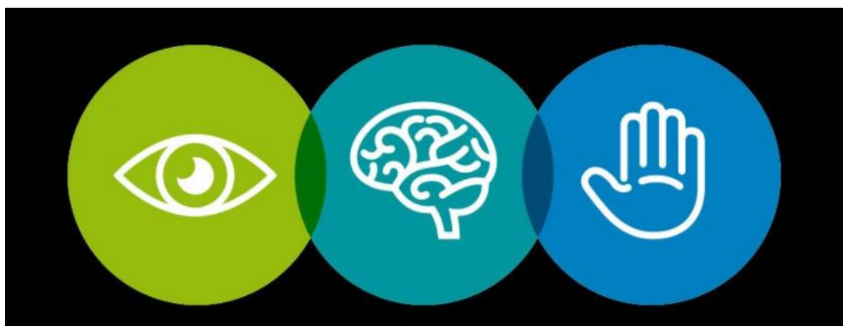
Kuva 1. Tarkkaamattomuus vaikuttaa kolmella tavalla: katse kiinnittyy pois liikenteestä, ajattelu keskittyy pois ajotehtävästä ja kädet ovat irti hallintalaitteista

Älypuhelimien myötä olemme tavoitettavissa kaiken aikaa ja kaikkialla. Liikenne on kuitenkin väärä paikka lukea työmaileja tai vastata tekstariin .