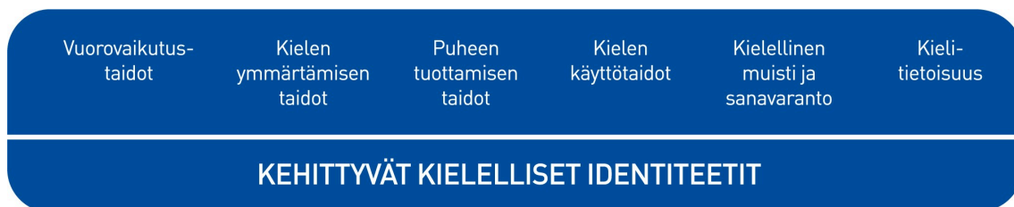
Kuvio 2. Lasten kielen kehityksen keskeiset osa-alueet varhaiskasvatuksessa

Kielen oppimisen kannalta on tärkeää tiedostaa, että saman ikäiset lapset voivat olla eri vaiheissa kielen kehityksen eri osa-alueilla. Kielelliset identiteetit kehittyvät, kun lapsia ohjataan ja tuetaan kielellisten taitojen ja valmiuksien keskeisillä osa-alueilla.