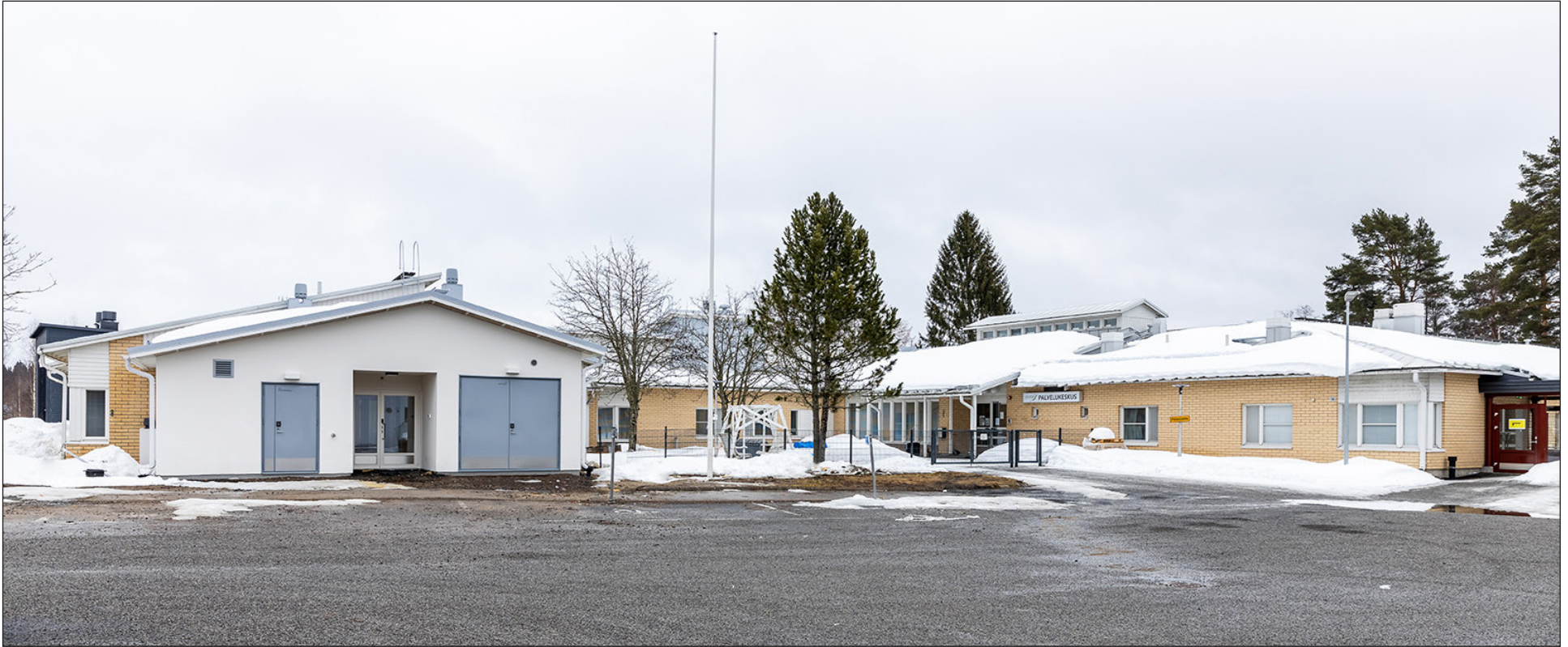
Hyvinvointialueelle siirtyminen ei tule vaikuttamaan esim. Palvelukeskus Jousen ja Sakuko-osaston toimintaan vuoden vaihteessa 2023.

Keski-Suomen hyvinvointialueen valtuustonpuheenjohtajan vierailusta saimme vahvan viestin ja tuen sille, että palvelut tulisivat säilymään, ellei jopa paranemaan Joutsassa. Meillä on uudet ja hyvät tilat, tänne kannattaisi keskittää palveluja. Jatkossa esimerkiksi etävastaanottojen, digipalveluiden, tukipalveluiden kehittäminen tulevat olemaan seuraavien vuosien kehittämisen kohteena.