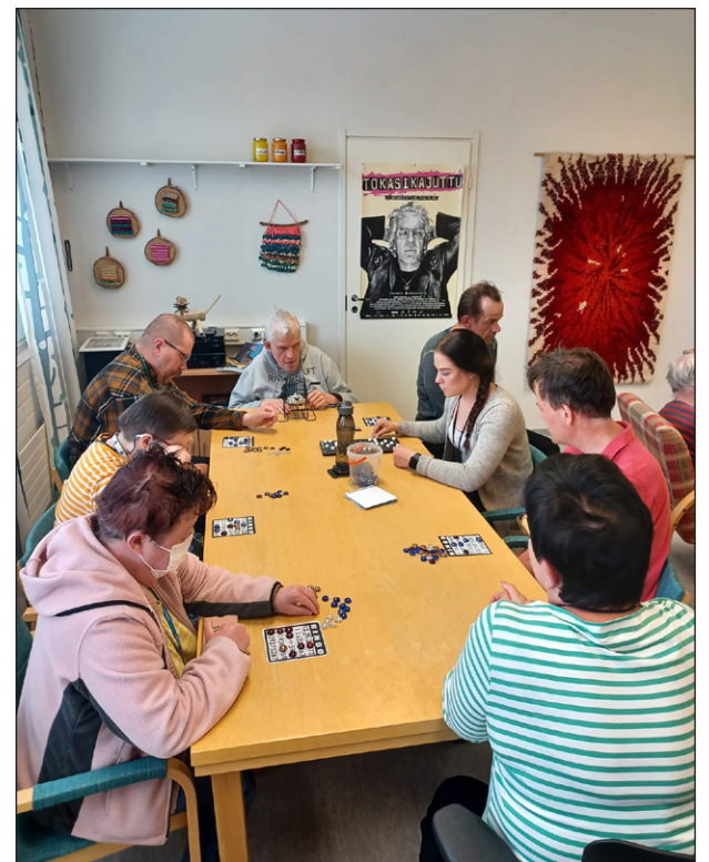
Bingo-päivät tulevat jatkumaan Helperissä myös vuonna 2023, sillä Helperin tuttu henkilöstö jatkaa työtehtävissään.

Asiakkaiden, niin ikäihmisten itsensä kuin heidän omaisten, näkökulmaan vuodenvaihte ei tuo suuria muutoksia. Puhelinnumerot tulevat säilymään samana, kaikki toimipisteet säilyvät samana, henkilöstö säilyy samana. Useiden palvelujen kohdalla on siirtymäaika, jona aikana sopeutetaan käytäntöjä ja turvataan asiakkaan turvallinen arki. Toimitilat ja tuttu turvallinen henkilöstö on auttamassa siirtymävaiheessa.