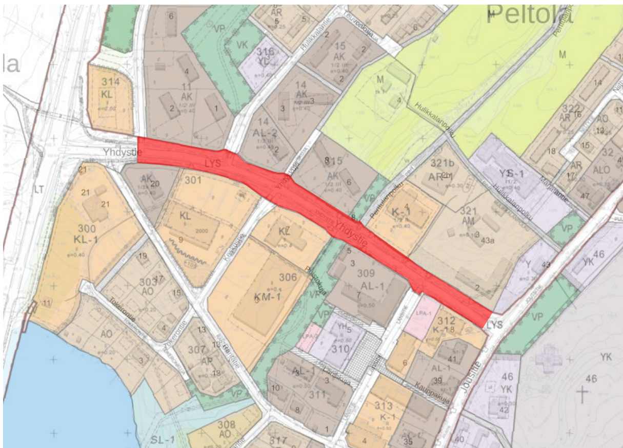
Kuva 1. Yhdystien kaduiksi muutettava maantiealue punaisella.

Asemakaavamuutos laaditaan Joutsan kirkonkylään Yhdystielle (16646), joka asemakaavassa on osoitettu liikennealueeksi (noin 0,6 km).