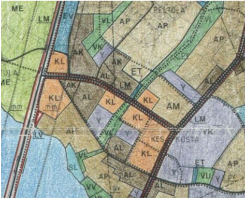
Kuva 3. Ote Joutsan Kirkonkylän oikeusvaikutuksettomasta yleiskaavasta 1990-luvulta. Yhdystie kuvassa keskellä.

Joutsan kirkonkylällä on voimassa oikeusvaikutukseton aluevaraustyyppinen yleiskaava 1990-luvun alusta.